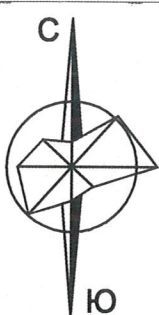
Схема границ зон с особыми условиями использования территории М 1:2000